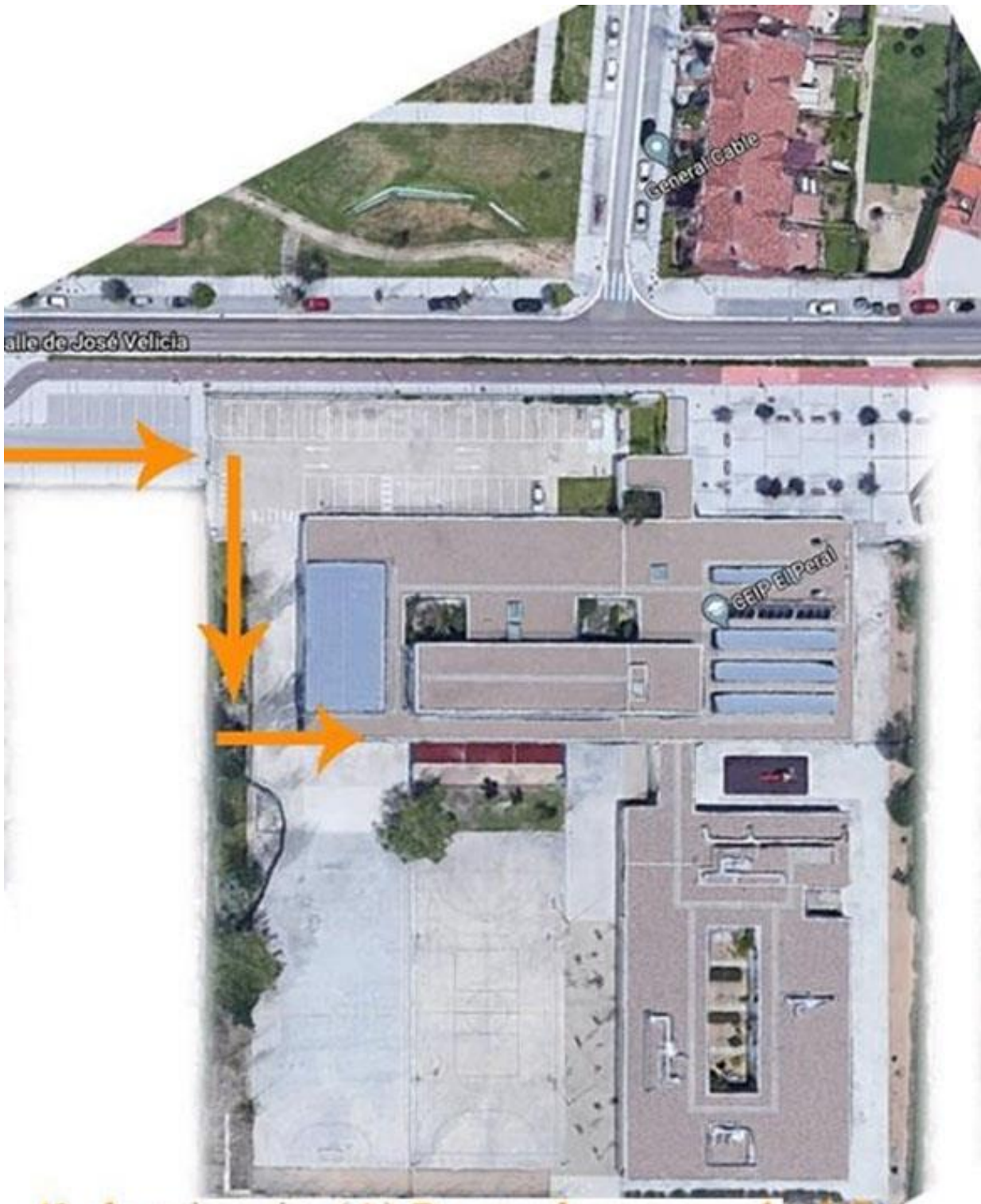
4° de primaria. (A) Puerta de acceso al edificio (B) por puerta de emergencia. (C) por puerta de 3°